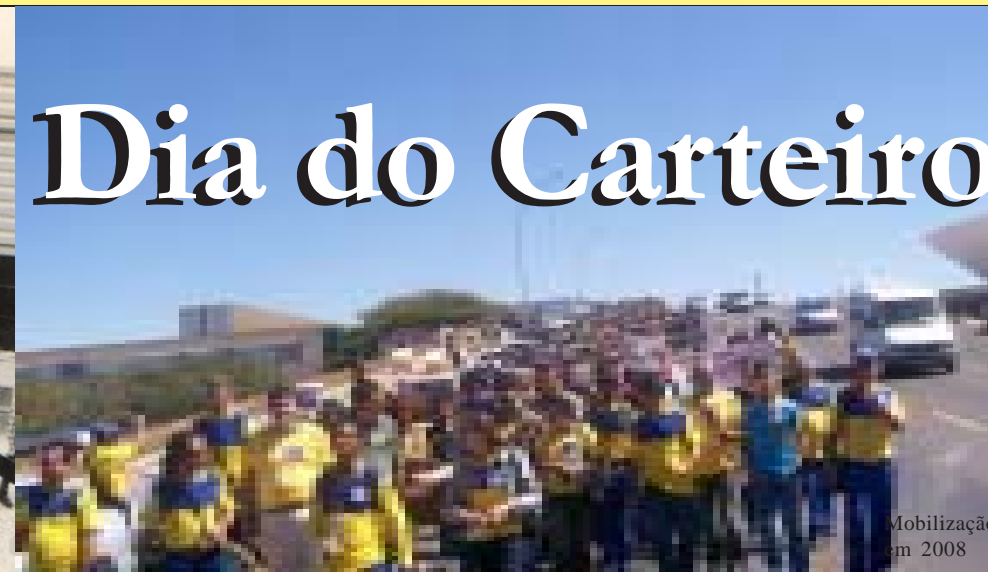
Mobilização em 2008

Quando o Brasil ainda era colônia, surgiu como figura marcante da nossa cultura nacional e símbolo importante da empresa, o nosso amigo CARTEIRO. Esperado por todo povo brasileiro, faça chuva, faça sol, lá está ele cumprindo com sua obrigação, levando mensagem de amor, de alegria, de esperança e de prazer, e também mensagem triste. Sua missão é unir corações com palavras de conforto e de felicitações. É o elo de ligação entre usuário e empresa, a pessoa querida e respeitada pela população. Através de sua dedicação e responsabilidade, tem como seu o dia 25 de janeiro.