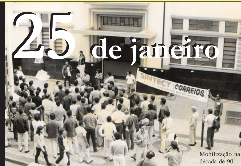
Mobilização na década de 90